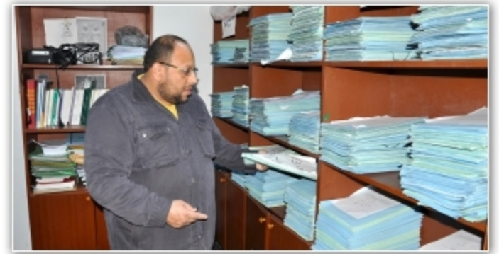
لجنة التعويضات بين الواقع وطموح المواطن ..