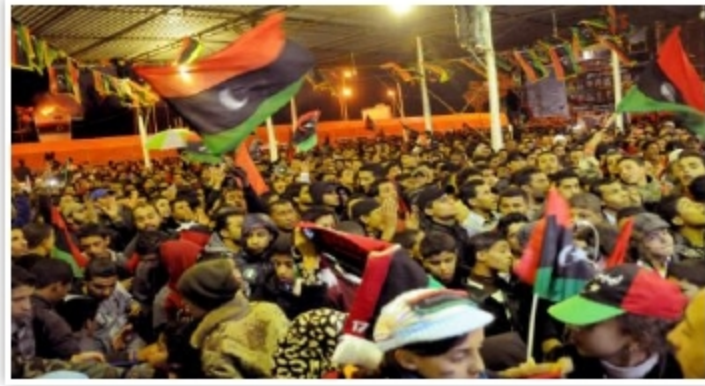
شعبنا الاحتفال بذكرى ثورته المجيدة الحكومة والمؤتمر لتفويت الفرصة على وأجل وقفته الاحتجاجية ضد أداء سير الانتهازيين والطامعين الذين يريدون

استغلال هذا الاحتقان لإشغال الفتنة للعمل على ادخال البلاد في فوضى عارمة ورجوعها إلى النفق المظلم من جديد ، نعم إن هناك مشاكل ومشاكل عديدة ومتعددة والصبر والحوار والاحتجاج بالطرق السلمية والمنظمة هو السبيل والمخرج للأزمات التي تقع ، فبالضغط والمطالبة يشعر أصحاب القرار بأنهم مطالبون من قبل شعبهم ومساؤلون أمامه في كل لحظة ، وهذا هو المسار الديمقراطي الذي نريد ، فهنيئاً لشعبنا بذكرى عيده الثاني لثورته المجيدة وعاشت ليبيا حرة ابية مستقلة منصرة قوية .