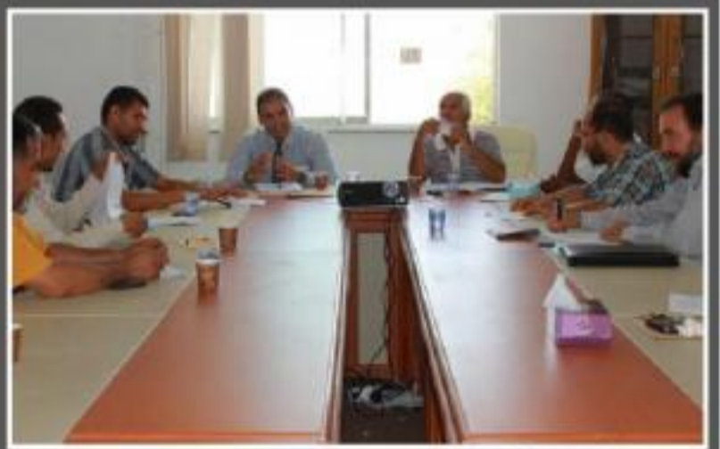
اجراء المراجعة لمجموعة طرابلس