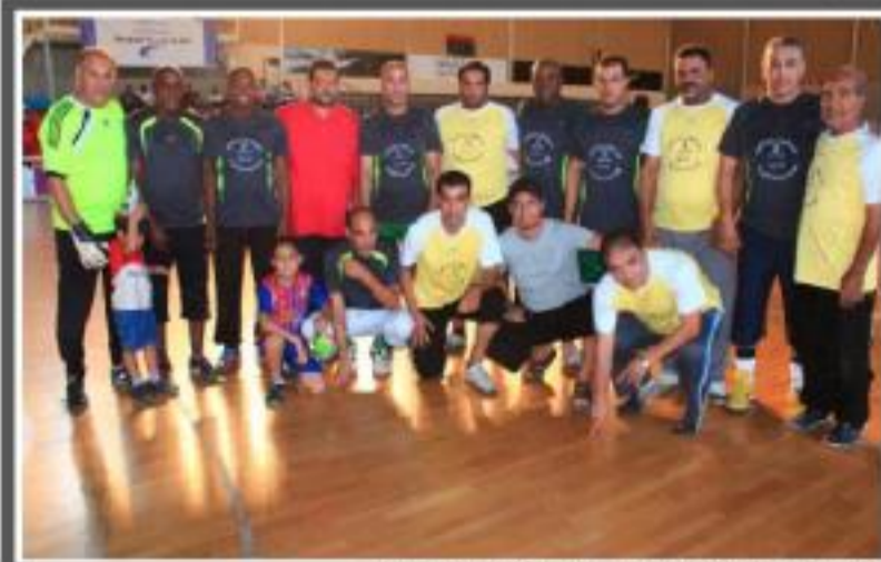
مجموعة الجعاج قدماء وزارة العدل وكدهاء الاهلي ببحر طرابلس