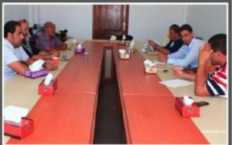
مجموعة اجتماعات اللجنة المنظمة